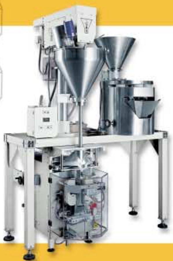
SEROVERT « FORM-FILL & SEAL MACHINE » Confezionatrice verticale ad assi Ensacheuse verticale avec contrôle des axes moteurs Vertikale Form- Fuell- und Schweissmaschine, "Axis-Control" 伺服驱动- 成形/充填/封口包装机