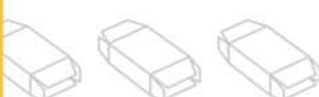
FLEX CASE 2000 HORIZONTAL CASE PACKER » Astuciatrice orizzontale ad assi Etuyeuse horizontale de caisses carton avec contrôle des axes moteurs Horizontale Faltschachtel-Aufrichtmaschine, "Axis-Control" 2000 型弹性水平装箱机