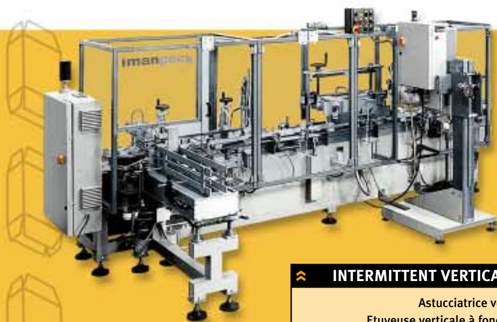
CTV 1000 / MCTN 2000 « INTERMITTENT VERTICAL CARTONING MACHINE » Astuciatrice verticale ad assi Etuyeuse verticale à fonctionnement intermittent Vertikale intermittierende Faltschachtel-Aufrichtmaschinen, "Axis-Control" CTV1000- 间歇式垂直纸箱成形机