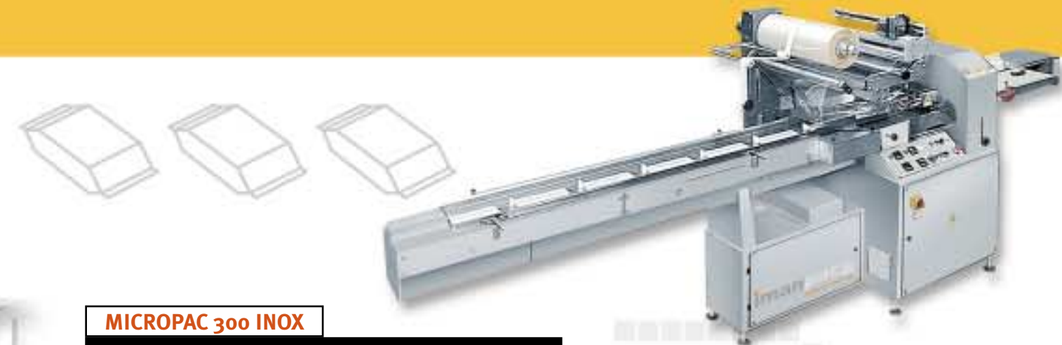
MICROPAC 300 INOX HORIZONTAL MECHANICAL WRAPPER » Confezionatrice orizzontale meccanica Ensacheuse horizontale version mécanique Horizontale Form- Fuell- und Schweissmaschine (Mechanische Ausfuehrung) 水平式裹包机