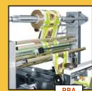
PBA Top Reel Holder Porta Bobina dall'Alto Portebobine Superieur Oberer Folien Rollentraeger