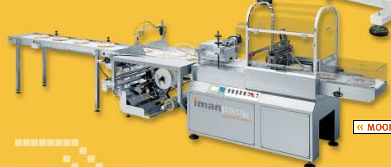
« MOONLIGHT »