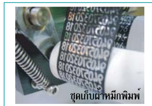
ชุดเก็บผ้าหมึกพิมพ์