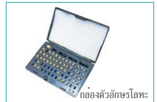
กล่องตัวอักษรโลหะ