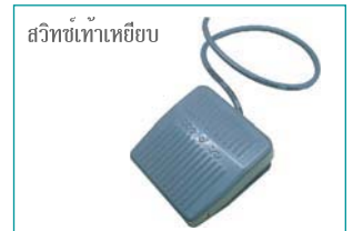
สวิทช์เท้าเหยียบ