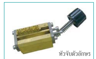
หัวจับตัวอักษร