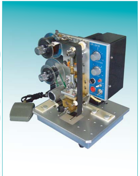
ตัวอย่างพิมพ์